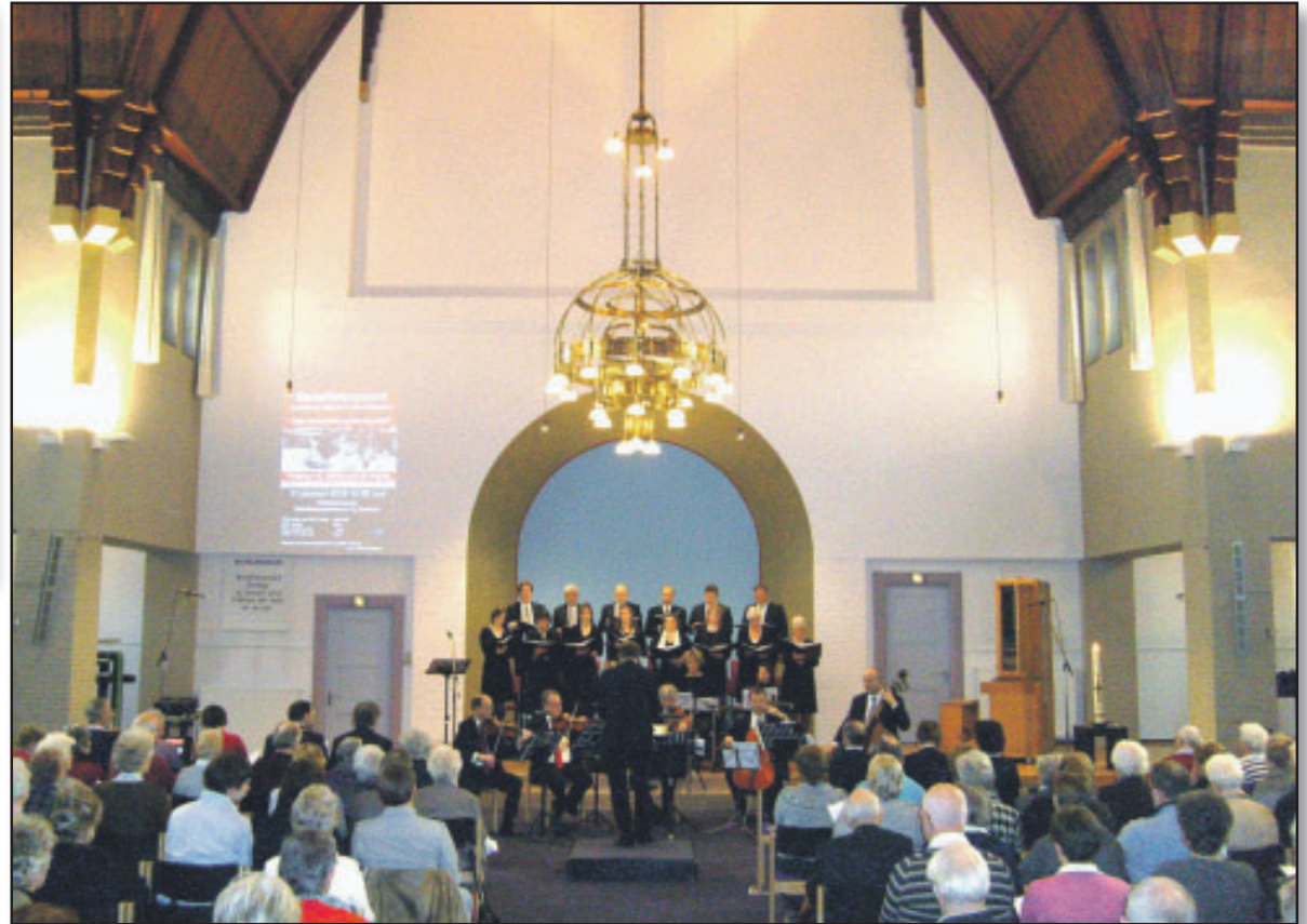
De Wilhelminakerk op 31 januari 2010 tijdens het Benefietconcert voor Haïti.

Het orgel kwam uit de oude kerk in de Iepenlaan, maar de architect vond het niet groot genoeg voor het gat boven de preekstoel. Het is toen uitgebouwd. De donkere driehoek is de onderzijde van de orgelkast. Het instrument was van slechte kwaliteit. Veel van de orgelpijpen waren van zink. Eigenlijk regenpijp-materiaal. Het orgel had daardoor geen warme klank. In 1969 heeft het nog eens een 'restauratie' ondergaan en werd het een 3-klaviers-orgel. In de jaren '90 kon het prachtige Flentrop-orgel uit de gesloten Vredekerk overgenomen worden en dat werd achter in de kerk geplaatst op de gaanderij. Het orgelgat boven het liturgisch centrum is pas in