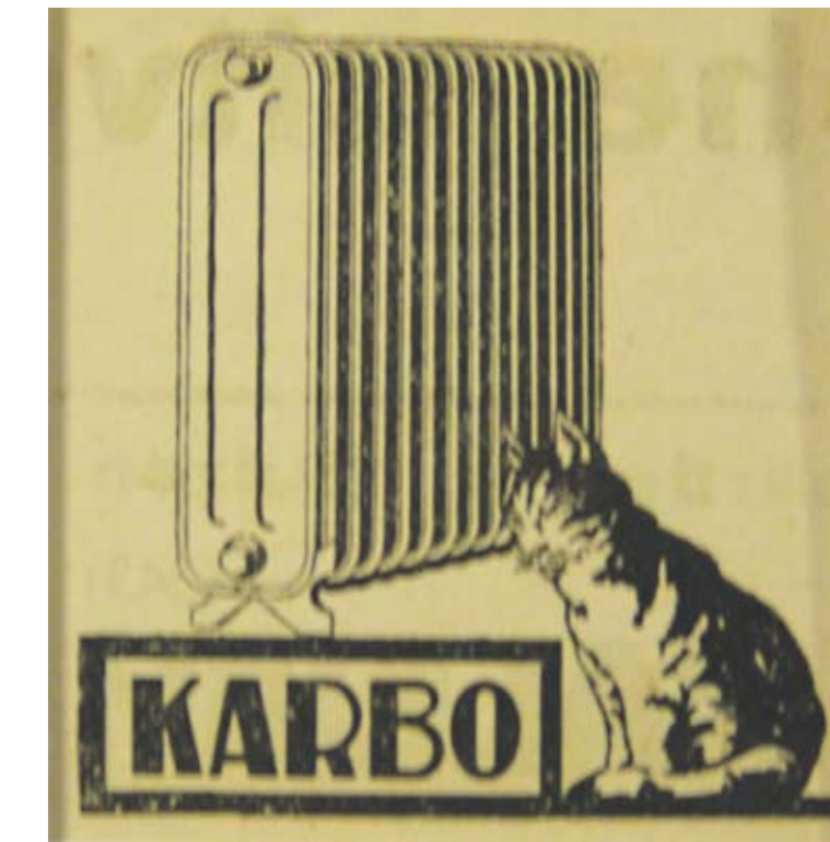
Fragment van KARBO-advertentie uit 1929

Wie vandaag naar “Continental” zoekt in Bussum, zal tevergeefs zoeken. Eind 1971 werd de sluiting van deze Bussumse fabriek, inmiddels onderdeel van Ideal Standard (Holland), aangekondigd. “Als een donderslag bij heldere hemel” voor de ongeveer 160 werknemers, waarvan