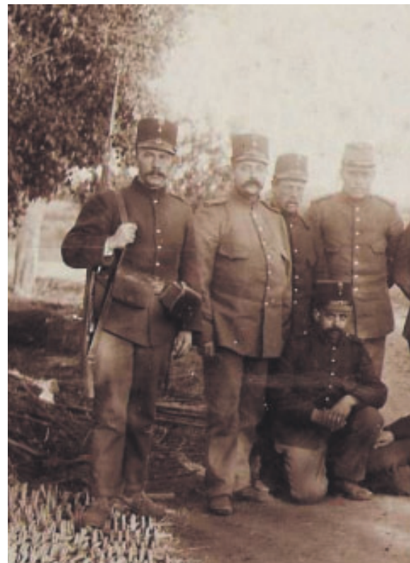
Deze mannen van het Nederlandse leger zagen er in 1914 nog opgewekt en weldoerend uit. Alhoewel Nederland neutraal bleef in deze oorlog verslechterde de voedselsituatie in 1918 en leden velen honger, vooral in de steden

In de Eerste Wereldoorlog 1914-1918 leek dat onvoldoende en werden er op de heilooptgraven gemaakt en schansen opgeworpen en puzzelde de legerleiding hoe men de verdediging verder kon verbeteren. Pas in 1918 besloot men over een afstand van ongeveer 8 km een dubbele loopgraaf met schuilgelegenheden aan te leggen van 's-Graveland tot onder Huizen. In mei 1918 werd