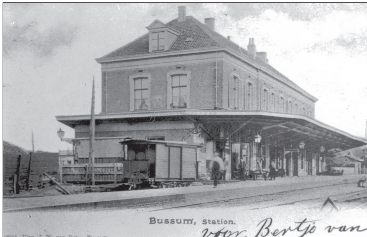
Station Naarden/Bussum 1885

Aan de sneltrein die Naarden/Bussum voorbij zou rijden, werd voor