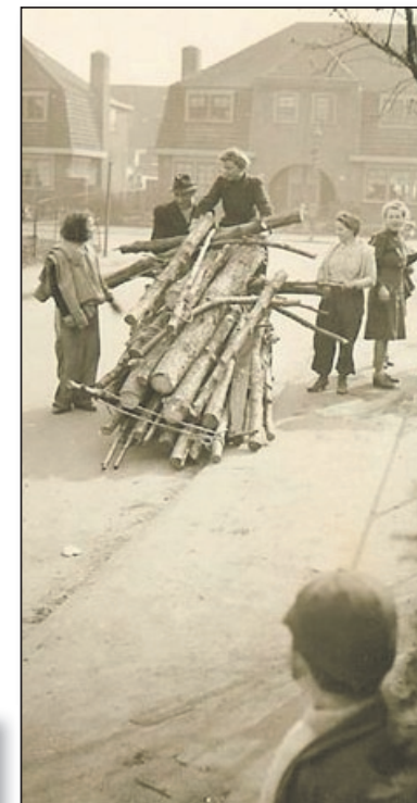
Winter 1945 op de Singel hoek Voor-meulenweg (Hist. Kring Bussum).

SAMENSTELLING: KLAAS OOSTEROM BRON: HET GOOIS NATUUR RESERVAAT. A.C.J. DE VRANKRIJKER. VAN DISHOECK 1957