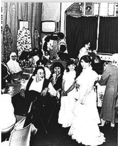
Naailes voor Turkse vrouwen in een gebouwtje aan de Brinklaan (mogelijk op nummer 55), jaartal onbekend

De Italianen en Spanjaarden waren vrijwel allemaal rooms-katholiek. Voor deze geloofsgroep bestonden in de regio voldoende voorzieningen. Veel van de betrokken kerken begeleidden de nieuwkomers daarnaast ook op andere terreinen. Dat lag anders voor Turken en Marokkanen: de islam was in Nederland een vrij onbekende godsdienst. Moskeeen waren er niet, islamitische religieuze verplichtingen en gebruiken waren doorgaans nieuw voor de Nederlander. Soms werd deze groep moslims tegemoet gekomen. Zo stelden gemeenten leegstaande schoollokalen ter beschikking voor het houden van gebedsdiensten en organiseerden sommige werkgevers aan het eind van de ramadan een maaltijd. Ook christelijke kerken boden Turken en