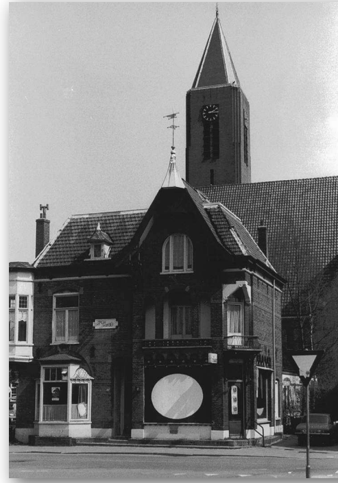
Centrum voor buitenlanders, Brinklaan 41 anno 1960