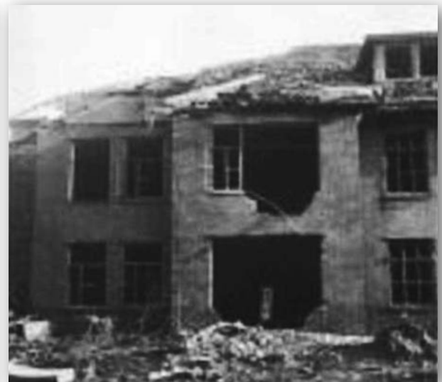
Crash 1957

In 1945 was er dringend legering nodig voor het personeel van de buitenbewaking van de legerplaats Crailo