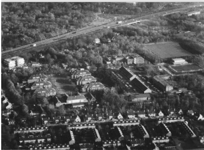
Luchtopname in kleur uit 2005 (coll. auteur)

Het stuk grond (de Westerheide was toen veel groter dan nu) werd begrensd door