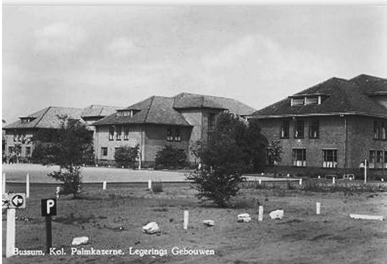
Legeringsgebouwen 1960

Met het aan het werk zetten van vijf projectontwikkelaars eind 2010 werd een belangrijke stap gezet. Een voorname eis is de aanleg van heel veel groen. Crailo grenst immers aan het bos- en heidegebied van het Goois Natuurreservaat (GNR), de Bussumer- en Westerheide. Van de in totaal 62 hectare gaat