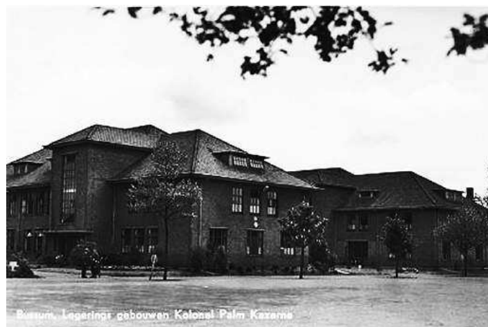
Legeringsgebouw 1960