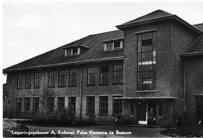
Legeringsgebouw 1960

Tot voor kort was Crailo een terrein met een kazerne, een militair oefenterrein en een asielzoekerscentrum. Door verschillende oorzaken zijn deze functies vervallen, waardoor een unieke kans is ontstaan het gebied een nieuwe invulling te geven,