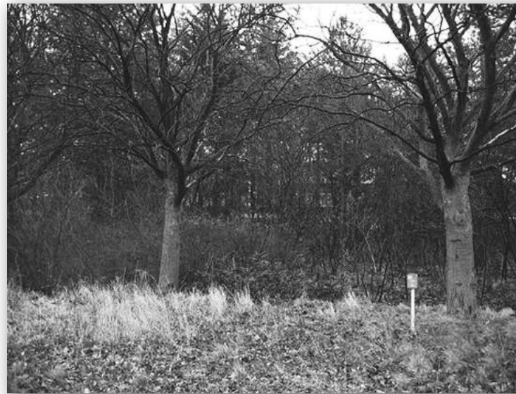
Natuur in omgeving Palmkazerne, 2011

Het voormalige terrein van het Asielzoekerscentrum (AZC) Laren maakt in de toekomst plaats voor groen. Laren wil het gebied teruggeven aan de natuur. Om de plannen betaalbaar te houden, wordt een klein gedeelte opgeofferd voor de bouw van hoogwaardige kantoorgebouwen (drie hectare). De nieuwe Larense 'ecologische zone' (minimaal zestien hectare) op het voormalige AZC-terrein gaat landschappelijk één geheel vormen met de Westerheide en sluit dan aan op het geplande ecoduct. De met elkaar verbonden groengebieden moeten dan vloeiend in elkaar overlopen.