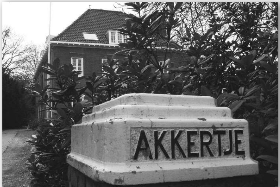
Toegang Het Akkertje, Parklaan 33

Aansluitend op dit artikel staat elders in dit blad het artikel 'Groene ruimten in het Spiegel' met korte beschrijvingen van plaatsen in het Spiegel die interessant zijn wat heden en verleden betreft en waar het groen royaal aanwezig is. De plaatsen zullen bezocht kunnen worden tijdens de gegidste fietsexcursie tijdens de Open