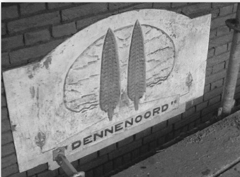
Heuvellaan 1 (Foto Derk Boswijk, 2011)

In het Algemeen Handelsblad van 2 Februari 1917 stond dit verslag van een tweegesprek in de Raadsvergadering van de gemeente Bussum: