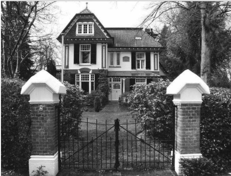
'Aan den Koedijk', Koedijklaan 2

Het Spiegel in Bussum is al vaak de mooiste wijk van Nederland genoemd: het heeft dan ook de status van beschermd dorpsgezicht gekregen. Betrekkelijk weinig villa's zijn 'rustiek' rietgedekt; neoklassieke en monumentale villa's zijn er veel meer gebouwd. Het Spiegel is een groene wijk. Daarmee past het Spiegel prima bij het thema van Open Monumenten Dag 2012 'Groen van Toen'. Hoe de wijk zich ontwikkeld heeft, in het bijzonder wat het groen betreft, wordt in dit artikel duidelijk.