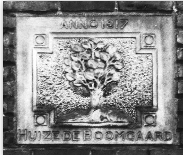
Gevelsteen Fortlaan 9

Klaas Oosterom is secretaris HKB en verwoordt en verbeeldt regelmatig de historie van Bussum in dit tijdschrift en in BussumsNieuws.