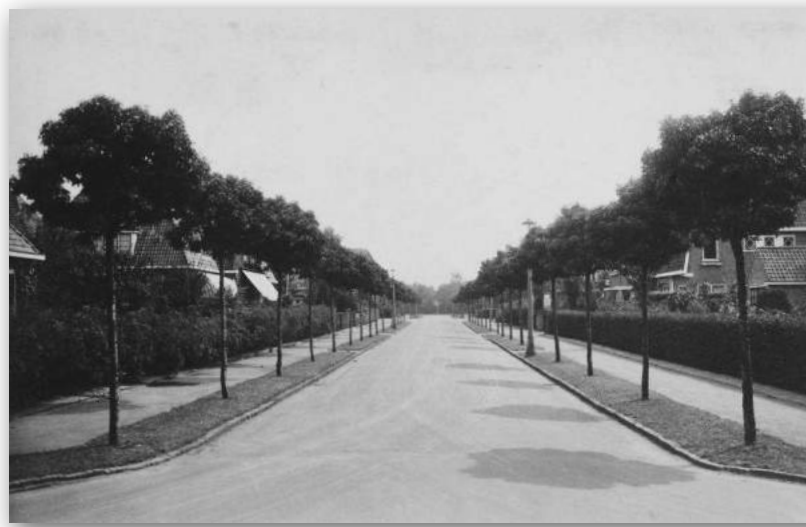
Publiek groen: Bellamylaan beplant met meidoorn ( Crataegus mon. Globosa ) 1936.

Omdat de bewoners van het Spiegel zelf belang hebben bij het voortbestaan van het groene karakter van de wijk is de Vereniging Vrienden van het Spiegel ( www.spiegelvrienden.nl ) opgericht. Deze vereniging probeert wensen of bezorgdheid van de bewoners over hun wijk naar de gemeente toe onder woorden te brengen en de belangen van de wijk te behartigen.