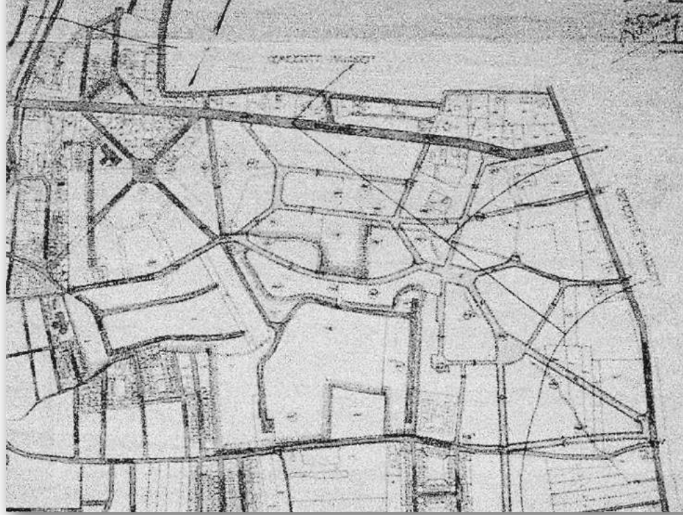
Kaart IV van het ontwerp van Tersteeg: Hoogtekaart met nieuwe hoogtepunten. Bijzonder aan het ontwerp van Tersteeg was dat hij de hoogteverschillen, die waren ontstaan door de ontzandingen, inventief benutte met een verrassend resultaat.

Ongeveer 20% van het oorspronkelijke oppervlak van het in opdracht van B&W ontworpen Park is al onder bebouwing verdwenen. Bescherming blijkt van groot belang te zijn wanneer we naar de reeds aangerichte schade kijken. Een van de eerste littekens in het Park wordt gevormd door de enorme hoek uit het