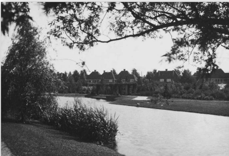
Bilderdijkplantsoen 1936. Pergola begroeid met rozen waaronder mensen op een bank zitten met voor zich traptreden naar het water.

Ongeveer 20% van het oorspronkelijke oppervlak van het in opdracht van B&W ontworpen Park is al onder bebouwing verdwenen. Bescherming blijkt van groot belang te zijn wanneer we naar de reeds aangerichte schade kijken. Een van de eerste littekens in het Park wordt gevormd door de enorme hoek uit het