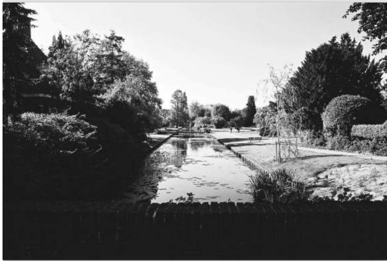
Zicht vanaf de brug tussen de Oud Bussummerweg en de Bilderdijkklaan naar het Bilderdijkplantsoen en het Mouwtje. Eén Park, met een onderhouden deel en een verwaarloosd deel.

Later is dit perceel nogmaals verkocht met bestemming bouwgrond. Het gevolg van deze verkoop is dat de Herman Gorterhof nu midden in het oorspronkelijke Bilderdijkplantsoen staat.