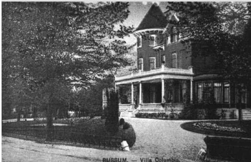
Particulier groen: Villa Columbia op de hoek van de Nieuwe 's-Gravelandseweg/Middenlaan. De villa is rond 1950 afgebroken

vierkante meter grond te benutten. Het wegenplan, waarvan men zegt dat Dirk Watez (tuin- en landschaparchitect 1833-1906) daar iets mee te maken zou hebben, was zodanig vormgegeven dat men zoveel mogelijk ruime percelen kon verkopen. Vergelijkt men de plattegrond van het Spiegel met andere ontwerpen van Dirk Watez, zoals het Volkspark in Enschede uit 1872, dan lijkt de conclusie gerechtvaardigd dat er in het geval van het Spiegel geen sprake kan zijn van een ontwerp voorafgaand aan de ontwikkeling. Wellicht is aan Watez gevraagd oplossingen te bedenken om de projecten, die inmiddels op verschillende plaatsen werden