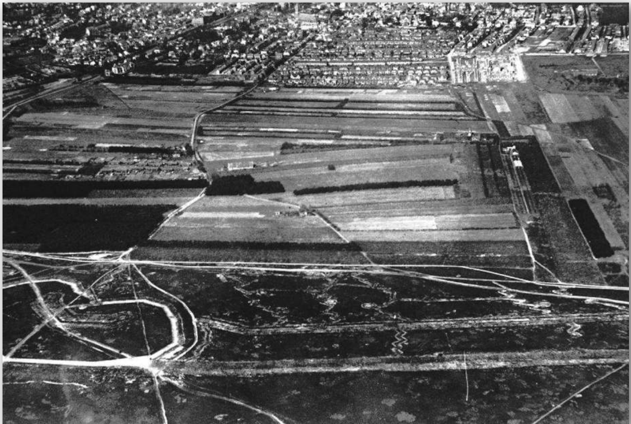
Afb.4 Luchtfoto van infanterieschans 1 (1938)