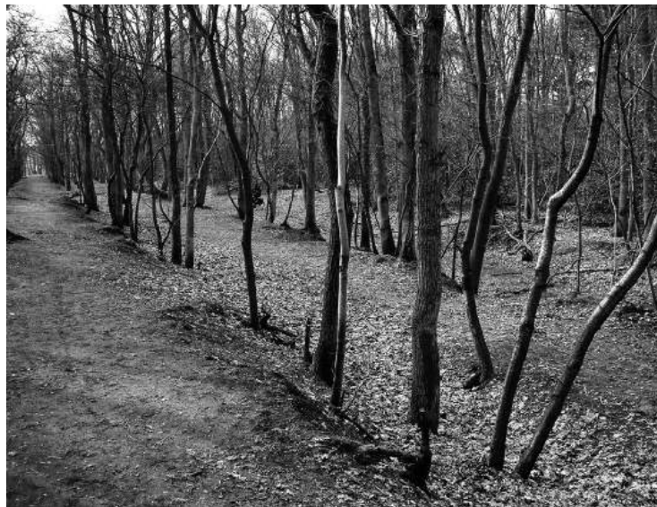
Afb. 5 Het 'Hobbeltjesbos'. Resten van de wal tussen de Schansen 1 en 2 langs het fietspad aan het eind van de Lorentzweg naar Crailo