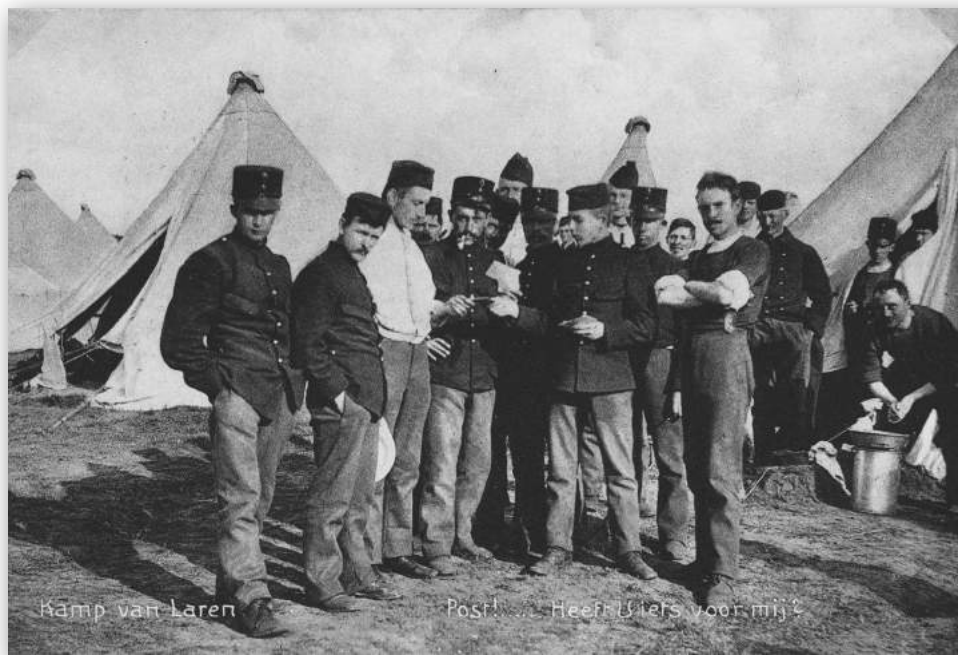
Afb. 3 In het Kamp van Laren gelegerde soldaten.

Nederland wilde tijdens de Eerste Wereldoorlog neutraal blijven. Dat wilde ons land tonen door zich naar alle richtingen verdedigend op te stellen. In het kader van deze zogenaamde neutraliteitsopstelling was de 1e Divisie sinds het begin van de mobilisatie gelegerd in Noord- en Zuid-Holland langs de Noordzeekust. Indien onze neutraliteit door een der oorlogvoerenden vanuit het oosten – dus door de Duitsers – zou worden geschonden, zouden wij bondgenoot worden van Engeland en Frankrijk. De vloten van die landen zouden dan Duitse landingen op onze kust verhinderen. De daar in de neutraliteitsopstelling gelegerde troepen, zoals de 1e Divisie, zouden dan beschikbaar komen voor de verdediging tegen vanuit het oosten aanvallende indringers. Tot deze divisie behoorden onder andere het Regiment Jagers en het 4e Regiment Infanterie. Een militair operatiegebied, dus ook een verdedigingslinie, wordt onderverdeeld in vakken. Voor het optreden in een vak worden dan troepeneenheden aangewezen. De Voorstelling vóór Naarden was verdeeld in twee regimentsvakken. Het oostelijke, vanaf de kust tot en met schans 5 bij de Sijsjesberg, zou bezet worden door het Regiment Jagers. Voor het andere vak, dat zich uitstreckte vanaf de Tafelbergheide tot de spoorlijn Bussum-Hilversum, was het 4e Regiment Infanterie bestemd.