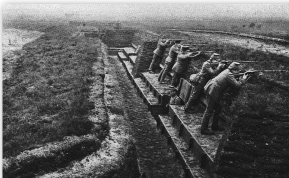
Afb. 2 Geweschutters opgesteld in een infanterieschans op de Bussumerheide, voorjaar 1915.

De schansen hadden een 120 tot 170 meter lange borstwering. Achter de borstweringen konden zich geweschutters opstellen. Schans 1 lag in de zuidwestelijke punt van de Bussumerheide, ten zuiden van de Laarderweg. Schans 2 lag in het kamp Crailo, schans 3 op de Blaricummerheide, schans 4 op de Tafelbergheide, schans 5 bij de Sijsjesberg, schans 6 op de Naardereng en schans 7 aan de kust op het huidige kampeerterrein. De infanteriewal die de schansen met elkaar verbond, was gedekt door een droge gracht met 60 meter daarvoor een brede prikkeldraadversperring. Achter deze wal kon de onderlinge verbinding tussen de schansen worden onderhouden. Zij was voorzien van een banket voor de geweschutters die daar de vijand onder vuur konden nemen (afb. 2). Op regelmatige afstanden waren er ook achter de wal schuilplaatsjes ingericht. Achterwaarts was deze lijn via zigzag-gegraven loopgraven verbonden met een netwerk van verbandplaatsen, telefoonposten, schuilplaatsen voor reservetroepen en latrines.