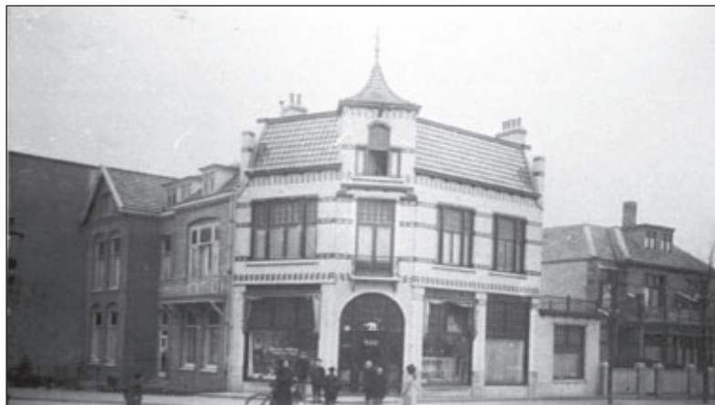
Hoek Havenstraat/Wilhemina-plantsoen

TE HUUR 1911: Modern ingerichte en ruime Winkel- en Woonhuizen aan de Havenstraat t. o. het Postkantoor en Wilhelmina Park, welke aldaar gebouwd zullen worden, en naar de behoefte der huurder worden ingericht, huurprijs f 400 à f 700 per jaar. Inlichtingen geeft W. WIGGERS DE VRIES. Archib. (Kantoor-villa Rusthoek )