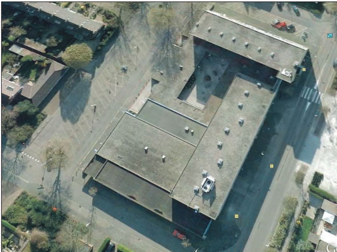
Foto van Google Earth van het winkelcentrum nu, op een stil moment genomen.