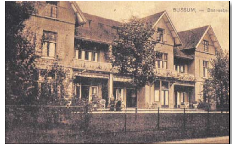
Beerenstein 1920.

door de Amsterdamse Stichting De Zonnehof, die het verbouwde en inrichtte voor huisvesting van een vijftigtal intensief verzorging behoevende bejaarden, dat duurde tot 1995. De laatste jaren was het een