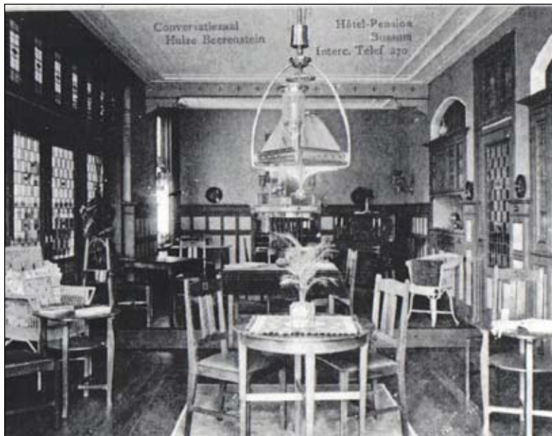
Conversatiezaal 1928.