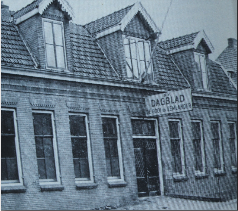
Pand aan Hoge Larenseweg te Hilversum

TEKST: KLAAS OOSTEROM BRON EN AFBEELDINGEN: DAGBLAD DE GOOI- EN EEMLANDER TIJDENS DE OORLOGSDAGEN EN DE EERSTE JAREN NA DE BEVRIJDING DOOR GUUS PIKKEMAAT 1991.