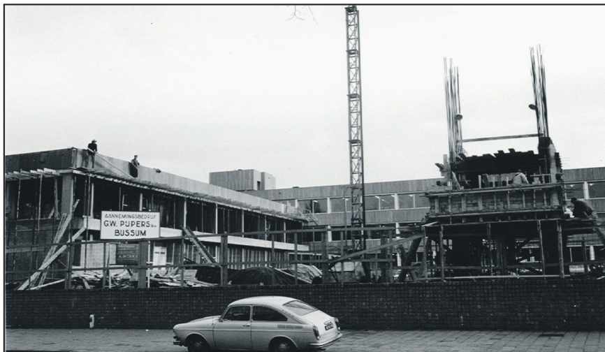
De Bestuursvleugel en carillontoren in aanbouw