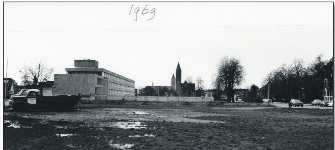
Het gemeentehuis in 1969 zonder bestuursvleugel