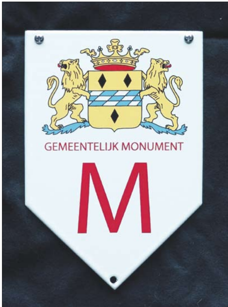
Schildje voor alle monumenten in Woerden.

In Bussum is men er nooit toe overgegaan om deze schildjes aan te brengen.