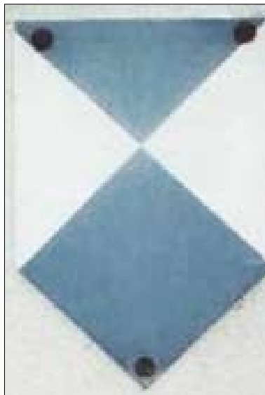
Internationaal schildje voor rijksmonumenten.

Daarom een oproep om dat wél te doen. Tenslotte heeft Bussum meer dan tachtig rijks-, provinciale en gemeentelijke monumenten. Weliswaar zijn de meeste niet te bezoeken, alhoewel er al vele op Open Monumentendagen opengesteld zijn geweest.