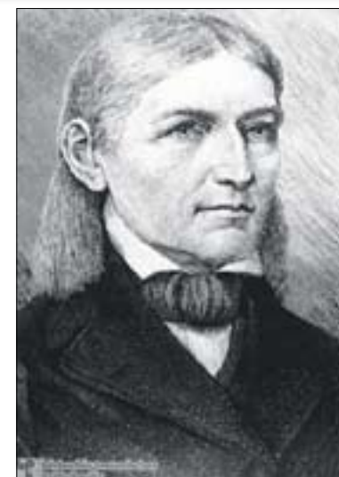
Dr. Friedrich W. A. Fröbel.

PS. Het begrip 'fröbelen' kreeg – volgens van Dale – later meer een betekenis van vrijblijvend bezig zijn, knutselen en zich met onnozelheden bezighouden.