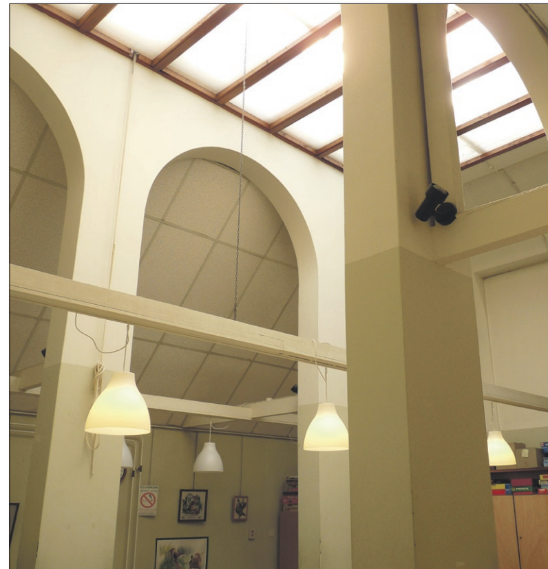
De arcaden uit de vroegere badzaal.