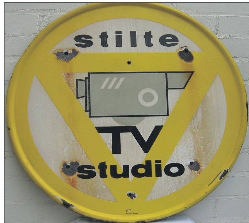
Dit unieke verkeersbord stond in de buurt van de Bussumse studio, maar had (uiteraard) een omgekeerd effect. Er werd in die jaren veel getoeterd in de Kerkstraat.

Deze en veel andere verhalen staan in HKB-publicaties: Een wandelboekje waarmee men langs alle plaatsen kan lopen die in de jaren 50 een rol speelden; het boek "Bussum en de televisie" en de DVD "Bussum, bakermat van de televisie".