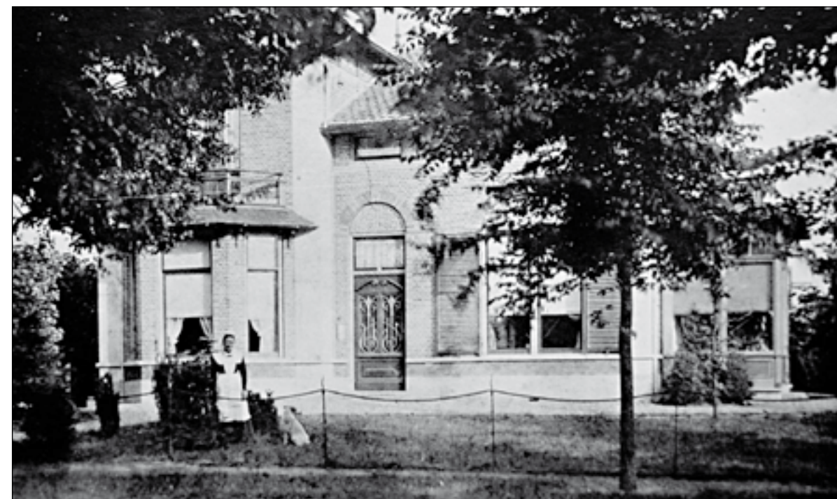
Directeurswoning Zwarteweg 5.

Hafkenscheid vestigde zich aan de Zwarteweg in Bussum (de villa staat er nog) en begon daar een nieuwe gasfabriek, nadat hij de concessie daarvoor bij het Bussumse gemeentebestuur in de wacht had gesleept. De fabriek in Bussum, die waarschijnlijk grotendeels werd opgebouwd met onderdelen van de Hilversumse fabriek, startte de pro-