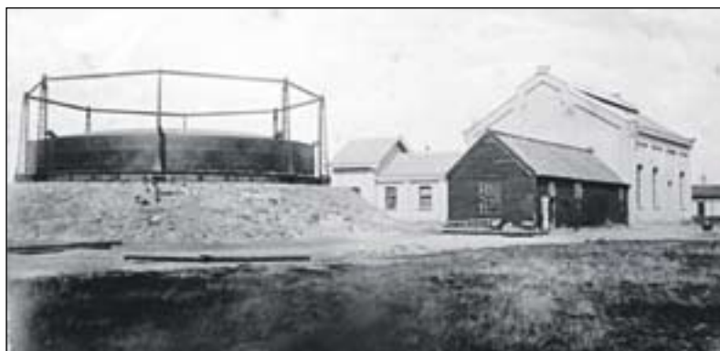
[Gasfabriek Bussum] Gashouder. FOTO: COLLECTIE STEEKARCHIEF NAARDEN

BRON: DE GASFABRIEK VAN HAFKENSCHIED DOOR EGBERT PELGRIM. EIGEN PERK 2007 NR 3. SAMENSTELLING: KLAAS OOSTEROM