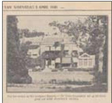
De Gooi en Eemlander 3 april 1940.