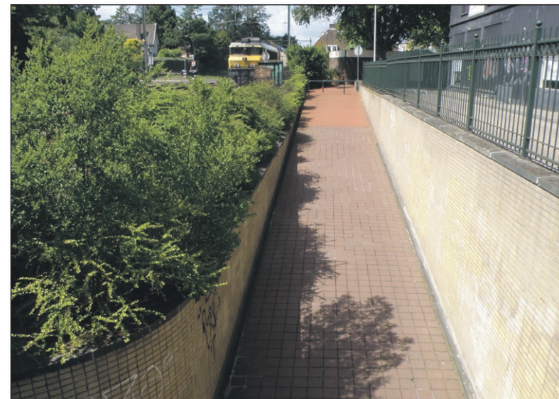
De toegang aan de dorpszijde nu, gezien van de Kloosterweg.

Zes overgangen waren er in Bussum. In 1917 kwam er de weinig gelukkig aangelegde voetgangerstunnel bij de Generaal de la Reijlaan. In 1923 en in 1926 werden de overgangen van de Nassaulaan, Heerenstraat en Gooibergstraat aanzienlijk verbeterd en verbreed; 30 Juni 1928 kwam het belangrijke viaduct aan het einde van de Brinklaan tot stand, waardoor bijv. het Majella-Ziekenhuis in 4 minuten van de Brink per auto bereikbaar werd.