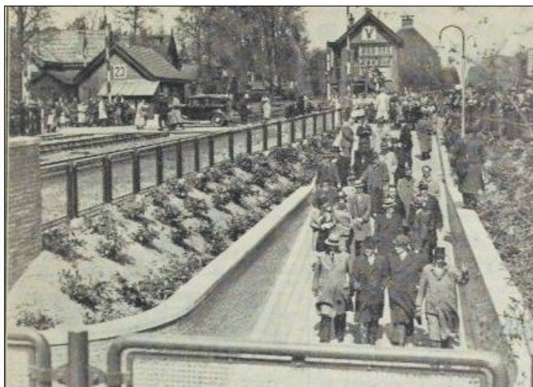
Burgemeester en genoodigden begeven zich in de nieuwe tunnel.