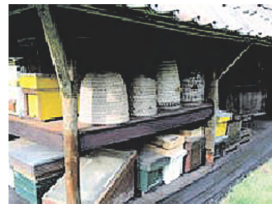
Bijenschans Museumlaan

De schans bij de Godelindestichting aan de Huizerweg is nog in gebruik, daar is de in 1918 opgerichte 'Imkervereniging Bussum e.o.' gevestigd. De thans ca. 45 leden kunnen worden beschouwd als hobbyimkers, meer dan om de verdiensten gaat het bij hen om de bijen en uiteraard ook om de honing. Buiten de schans aan de Huizerweg, waar tevens de grootste opstelling van bijenkasten is, beschikt de vereniging over een schans in de omgeving van de Mu-