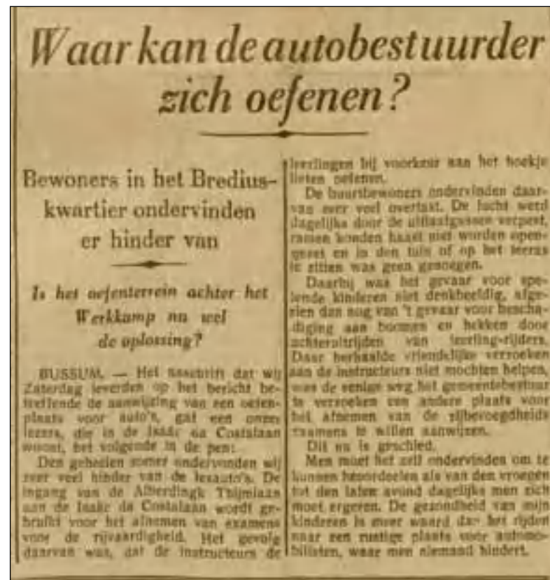
De Bussumsche Courant d.d. 14 november 1939.

Burgemeester en wethouders komen met een oplossing: op de Oostereng is ooit begonnen met de bouw van een villapark en vanaf de Rijksweg zijn toen alvast twee wegen aangelegd (het begin van de huidige Koekoeklaan en de Leeuweriklaan). De villabouw is