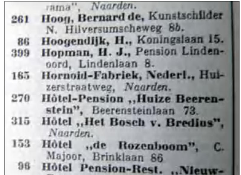
Detail van pagina

Aardig om de naamlijst eens langs te lopen. Wie en wat komen we