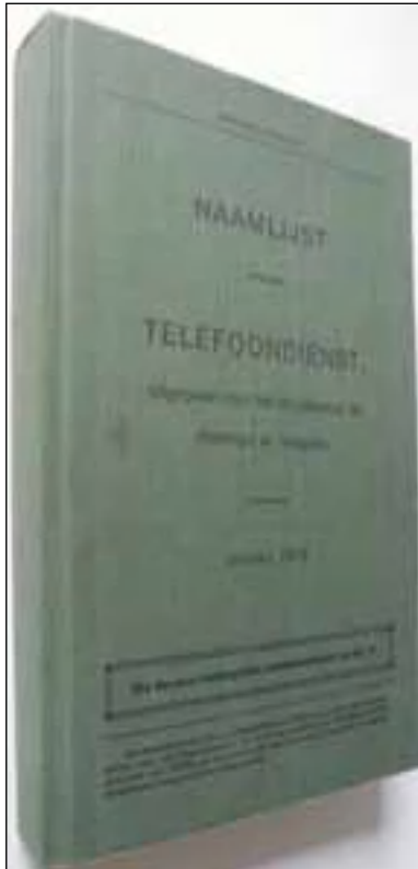
Het telefoonboek van 1915.