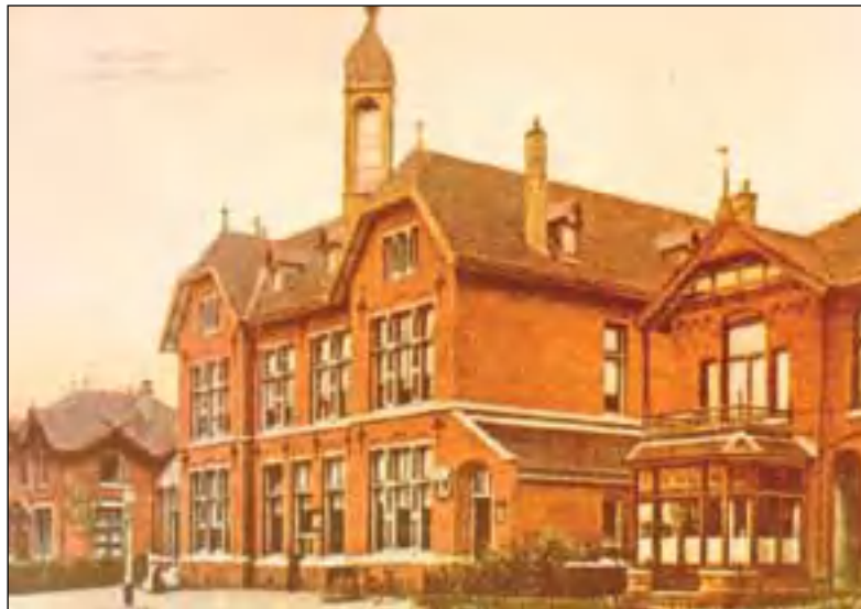
Het postkantoor van Bussum omstreeks 1915.

zoal tegen in het Bussum van 1915 en met welk nummer?