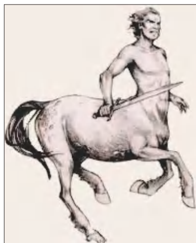
Cheiron, een figuur uit de Griekse mythologie (centaur: half mens, half paard) was beroemd om zijn kennis van de geneeskunde.

aan voor de oprichting van een fabriek voor 'het malen van kruiden, bladen en houtvezels en voor het onttrekken van harsen en oliën'. De fabriek zou gebouwd moeten worden op een perceel tussen de Lambertus Hortentiuslaan en de Vaart, dus net buiten Bussum. Omwonenden, vrezend voor geluid- en stankoverlast, komen o.l.v. agrariër J. van Eijden tegen de plannen in het geweer. De bezwaren worden afgewezen en de fabriek wordt gebouwd. In 1915 wordt een nieuwe Hinderwetvergunning aangevraagd voor verbouwing en vergroting van de fabriek, inclusief kantoorruimte. Deze vergunning vermeldt dat er zes mannen werkzaam zijn en (als subtiele toevoeging) 'geen vrouw'.