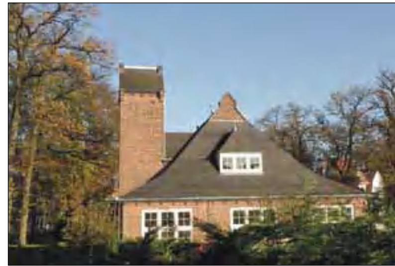
Achtergevel en toren.