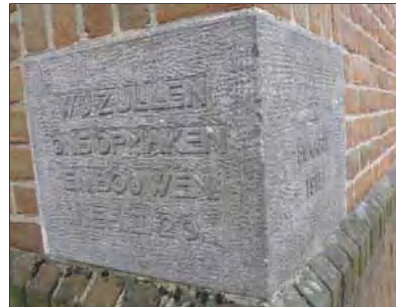
Hoeksteen: 'Wij zullen ons opmaken en bouwen'. Nehemia 2 vers 20.