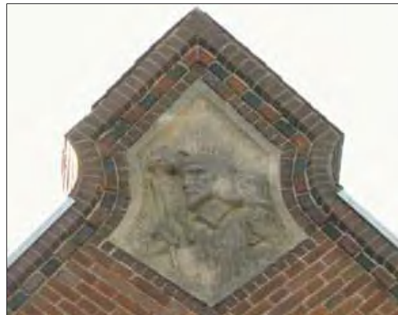
Jezus als Goede Herder boven in voorgevel.