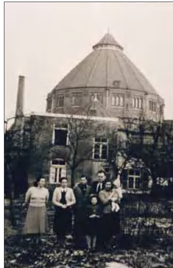
Italiaans gezin Esiaan 5.

Als een spannend feuilleton ontrolde zich najaar 1961 in de Bussumsche Courant de berichtgeving over procuratiehouder J. Met 3500 gulden op zak werd de Bussumse bankemployé in Amsterdam een nacht ingesloten vanwege rijden onder invloed. Daarna verdween hij. Onderzoek wees uit dat J. hem toevertrouwd spaargeld