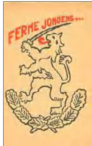
Slimme propaganda in 1943 van Landstorm Nederland: geen Nazi-symbolen.

In september 1944 werden ze voor het eerst ingezet: in België, waar ze onder meer tegen Nederlanders