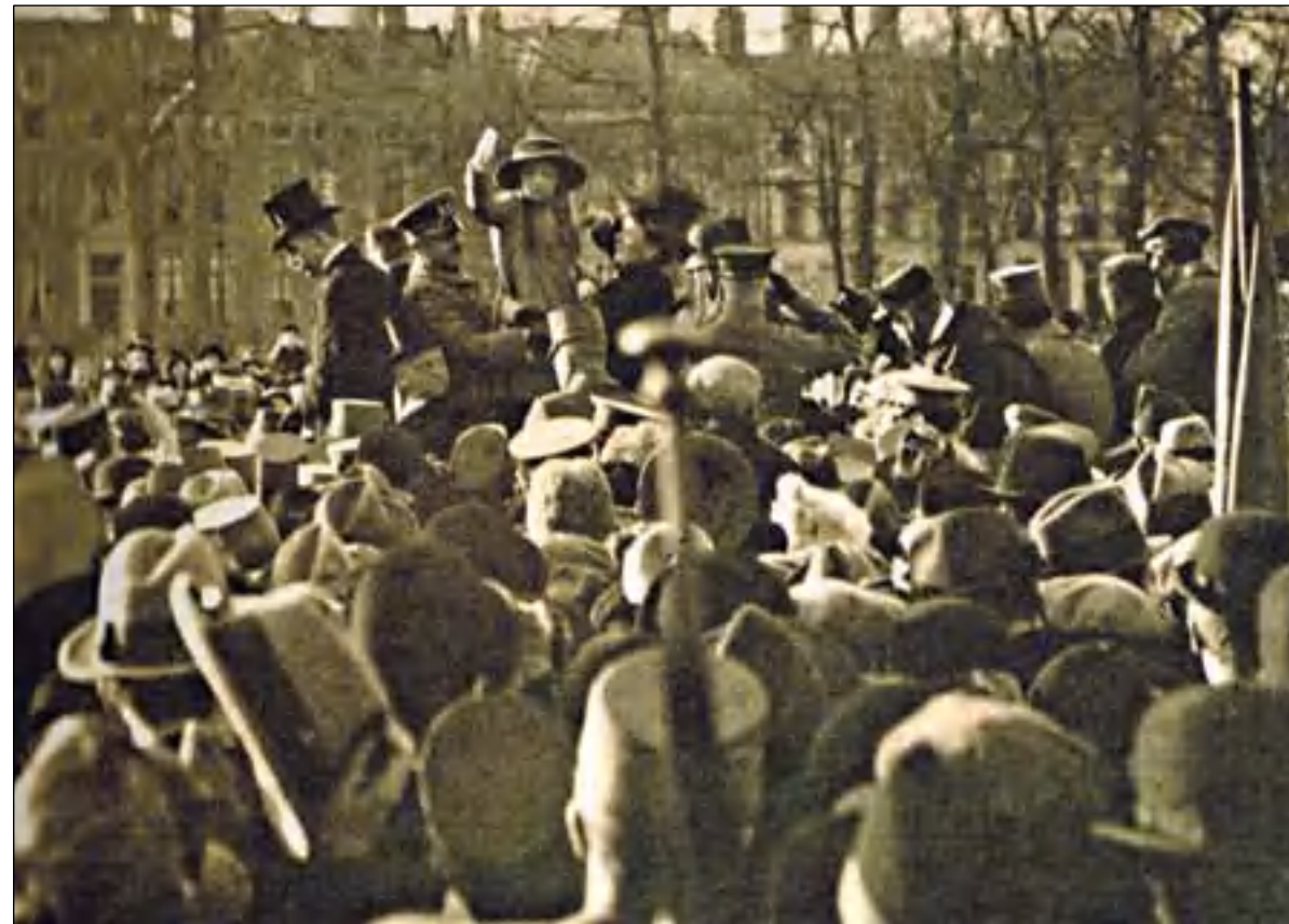
De Huldebetooging op 18 November.

den er korpsen Bijzondere Vrijwillige Landstorm, ook in Bussum. Al op maandag 18 november 1918 trokken velen naar Den Haag om aan de 'Grootsche huldebetooging' voor H.M. Koningin Wilhelmina op het Malieveld deel te nemen. Aanleiding was een oproep van de socialist Troelstra, die in Nederland een revolutie wilde ontketenen. Tijdens een tocht van het koninklijk gezin wer-