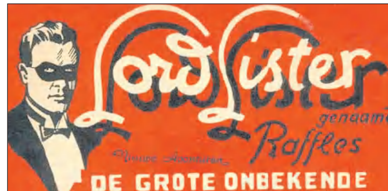
Lord Lister.

Wederom stond heel Bussum op zijn kop! 'De Gooi en Eemlander' schreef over Amerikaanse gangstermethodes en legde meteen een verband met de eerdere overval op het Stationskantoor. Politiecommissaris de Wilde loofde de f 500 beloning uit voor aanwijzingen die zouden leiden tot arrestatie van de dader. Enkele dagen later arresteerde de politie een zekere B., die ook al in beeld was geweest na de overval op het Stationskantoor. Hij was bewoner van een woonwagenkamp aan de Spaarndammerdijk in Amsterdam en was hevig verontwaardigd over zijn arrestatie. In de woonwagen van B. vond men een zogenaamde toneelrevolver, waarvan de loop