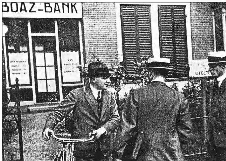
Na de overval op de Boaz-Bank.