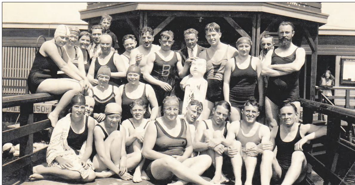
Zwimmers en zwemsters, maar uit welk jaar?