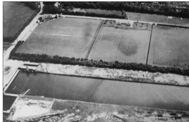
Luchtfoto uit 1925. Linksonder het zwembad.