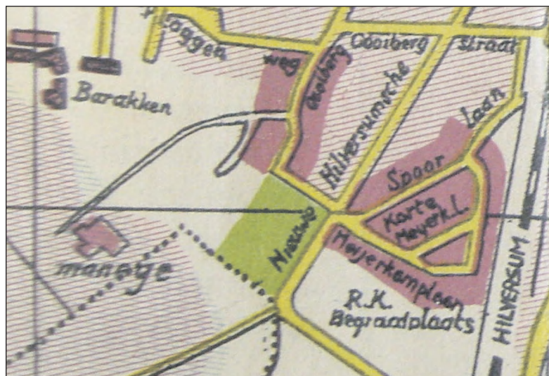
Troephuis, niet ingetekend, stond bij Manege (detail plattegrond Bussum 1937).