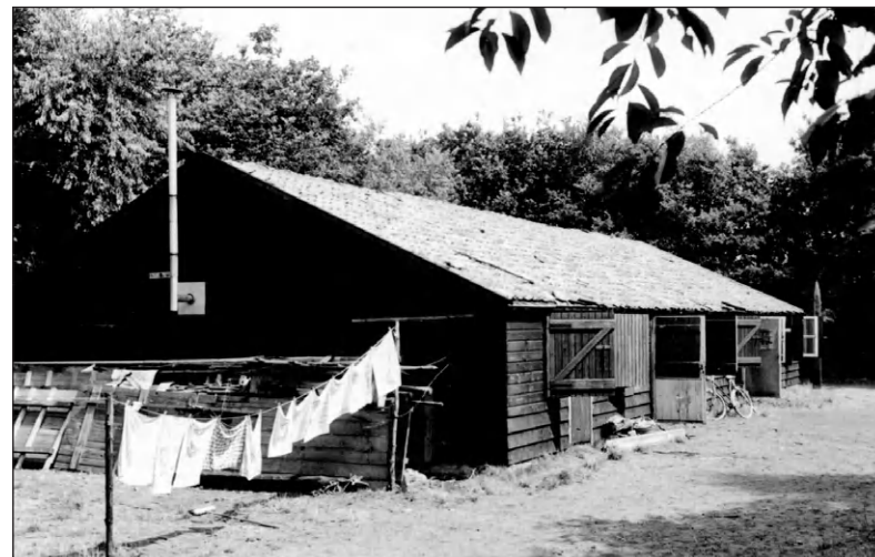
Het Troephuis dat in 1946 op dezelfde plaats werd gebouwd.

Erg lang heeft men niet van het huis kunnen genieten. De padvinderij moest op last van de Duitse bezetter in 1941 stoppen. Het houten gebouw is in de jaren erna gaandeweg in noodkacheltjes opgestookt. In 1946 werd een nieuw clubhuis gebouwd dat ook door