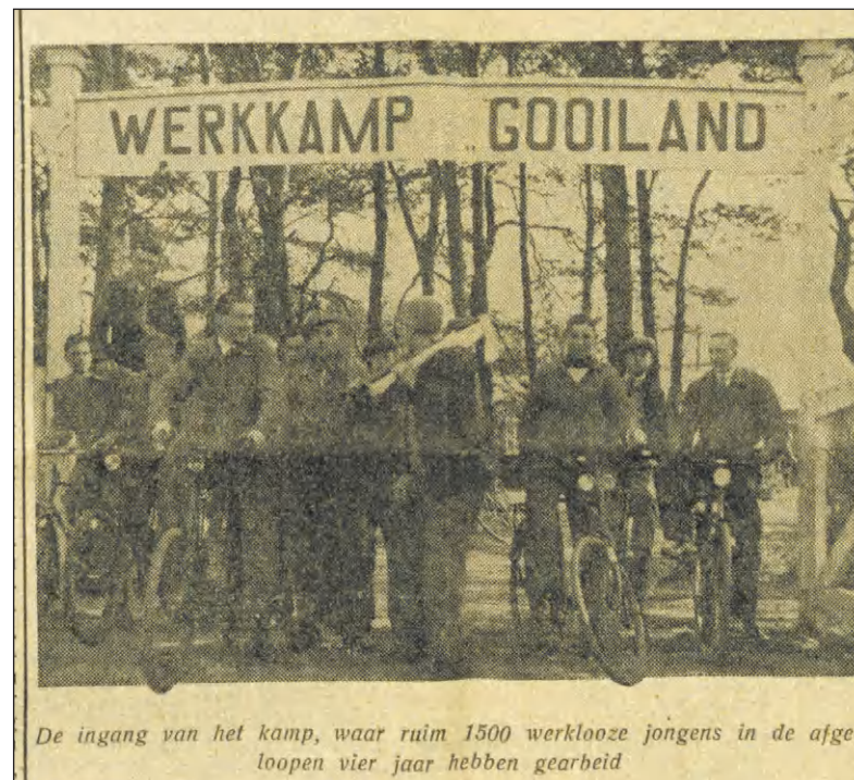
De ingang van het kamp, waar ruim 1500 werkloze jongens in de afgelopen vier jaar hebben gearbeid

door het CNV hier voor een vakantie zijn ondergebracht. Lezingen, excursies en gezellige avonden brachten afwisseling te over om de week te doen omvliegen.”