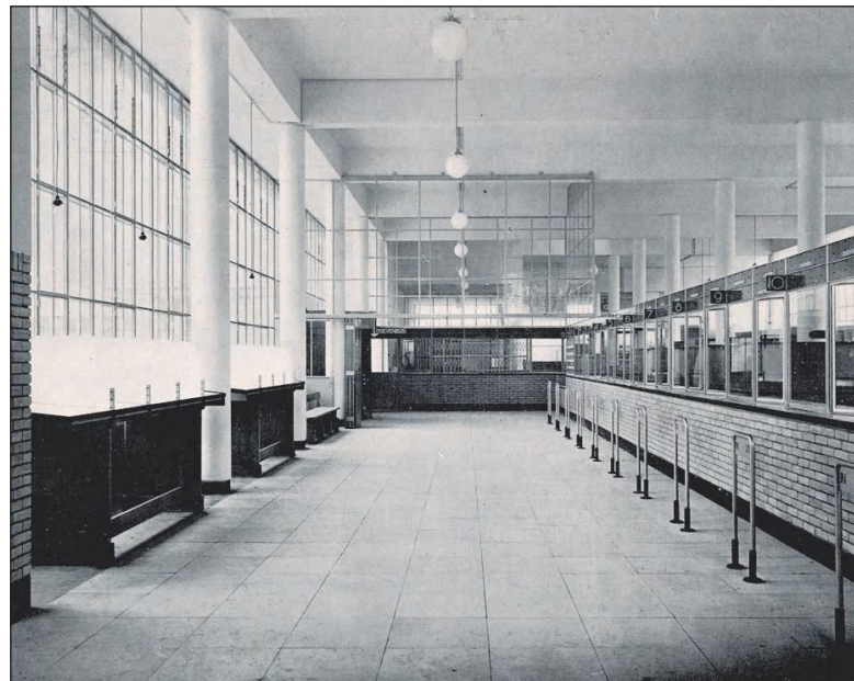
Wachtzaal voor het publiek met 11 (!) loketten in 1936.

gemeente overweegt om van een deel een gemeentelijk monument te maken. Er zijn onder de bevolking genoeg ideeën voor een nieuwe bestemming, maar de gemeente is muisstil.