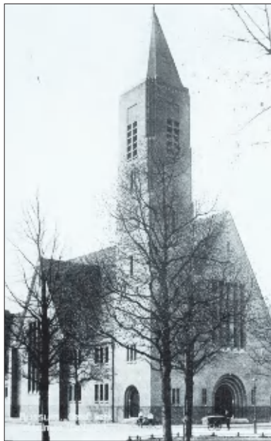
De Wilheminakerk in 1926