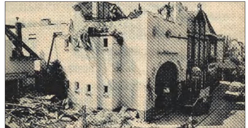
Slopers (of kinderen?) zijn gevaarlijk bezig. Bioscoopstoelen staan op de stoep.

De winkel die op die plaats van bioscoop en huis kwam heeft inmiddels alweer verschillende bestemmingen gehad. Boven de winkel zijn woningen. Hier enige foto's uit de kranten van vóór en tijdens de sloop.