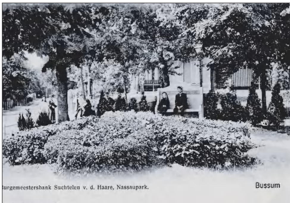
De Van Suchtelenbank een eeuw geleden