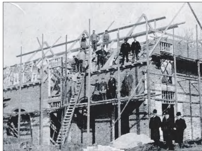
Een bouwproject omstreeks 1900? Van Norren is de middelste heer van het groepje rechts. Wie weet waar dit is en wanneer?

Dit tijdschrift is voor € 7,50 te koop bij de HKB en boekhandel Los. Als je lid van de HKB wordt voor € 15 per jaar krijg je alle nummers.