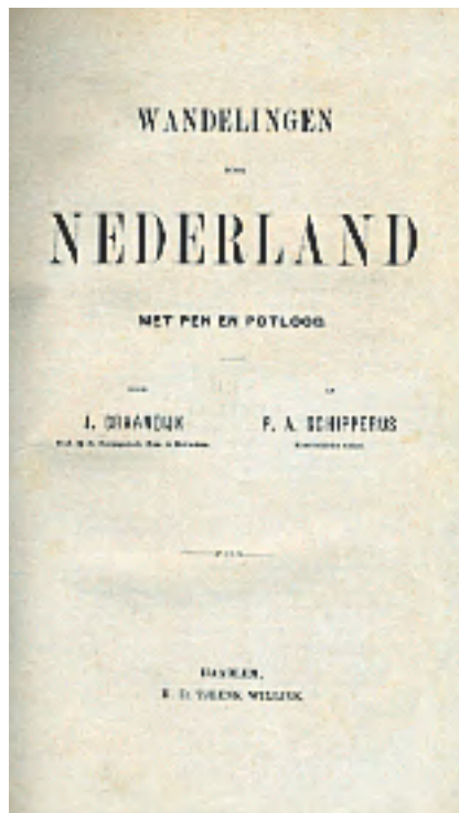
Boekomslag 'Wandelingen door Nederland'