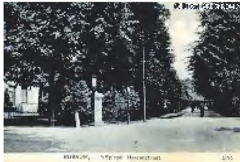
Het Spiegel eind 19e eeuw.

- Nieuw-, Klein- of Laag-Bussum, een klein landelijk dorpje. Het laatste is ook wel in menig opzicht vernieuwd, maar het is toch overoud in vergelijking met de zeer jeugdige buurt, die eerst van den jongsten tijd dagteekent en die bij uitnemendheid Nieuw-Bussum heet.' Craandijk richt zijn eerste schreden op Nieuw Bussum (Het Spiegel). Daarover tekent hij op: 't Is een plaats der toekomst. Er zijn brede wegen, met boomen beplant. Overal villa's in bloementuinen met grasperken, heestergroepen,