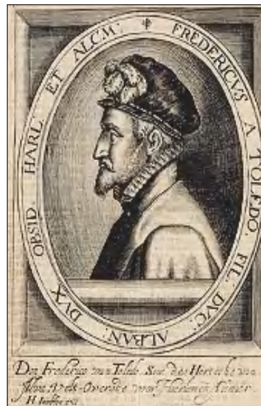
Don Frederik de Toledo

Na deze lovende observatie, haalt Craandijk een stukje geschiedenis aan .. 'van het stille en afgelegen Bussum. Alleen het vertoef van Don Frederik de Toledo, in de voor 't naburige Naarden zoo noodlot-