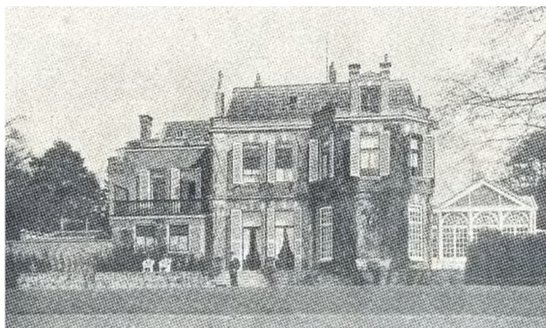
Landhuis Bantam omstreeks 1910

Huizerweg 54 - 1402 AD Bussum Telefoon 035 691 29 68 www.historischekringbussum.nl hist.kring.bussum@planet.nl