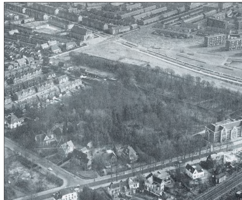
Bouvy Gronden in 1960 met onder de Brinklaan en rechtsboven de Ceintuurbaan uit 'In Bussum kan alles...'.