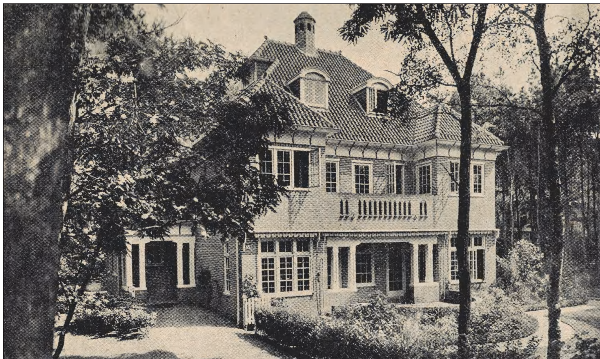
Het landhuis kort na de bouw in 1913.