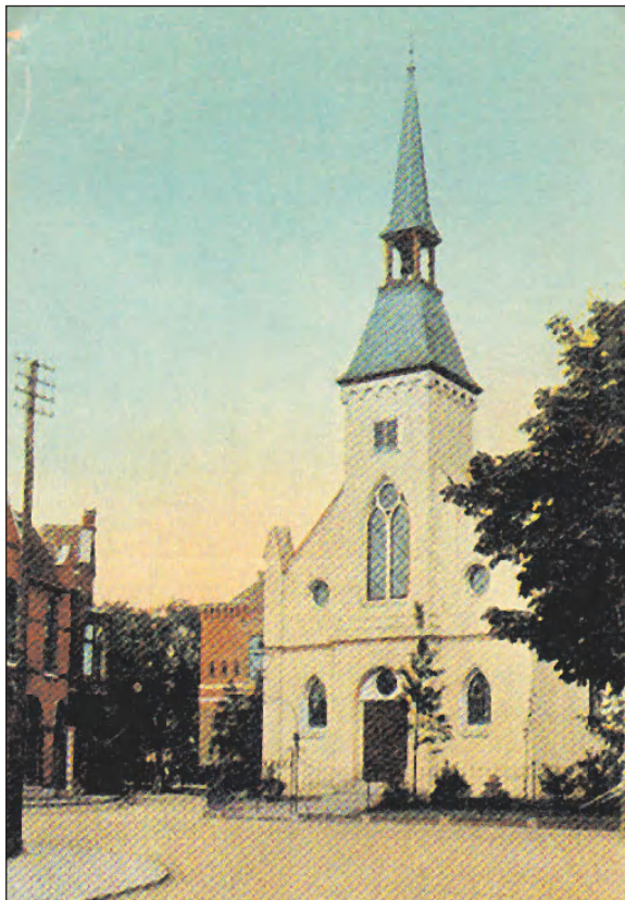
Het voormalig kerkje als militair tehuis in 1914-1918.