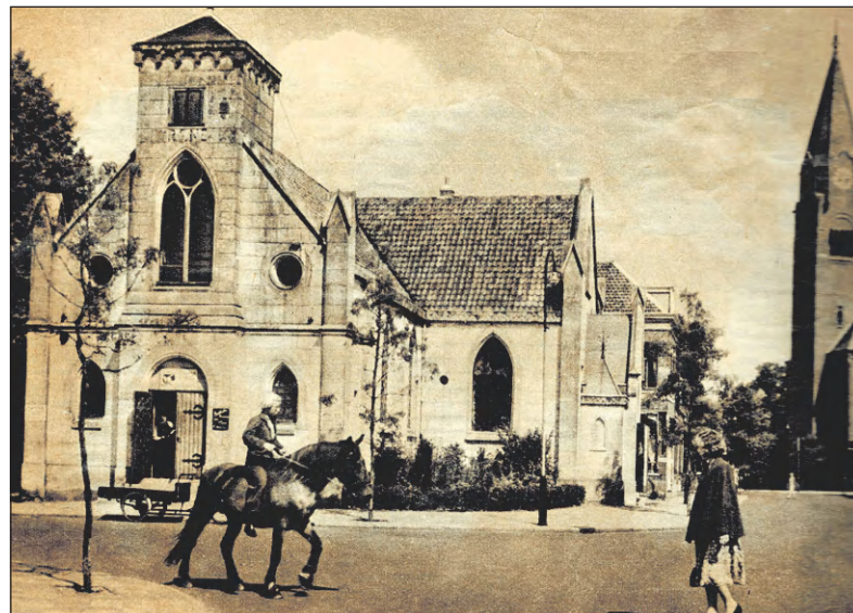
Gebouw Irene met de afgeknotte toren.

De naam IRENE bleef tijdens de oorlogsjaren, zij het minder goed zichtbaar, gehandhaafd. Een opsteker voor de bevolking want praktisch alles wat aan leden van het koninklijk huis herinnerde, moest verwijderd worden. Na de oorlog kwam er een metaalhandel in en daarna weer een verkooplokaal, nu voor tweedehands goederen. Toen de publieke omroep een ruimte zocht in de buurt van Hilversum, viel het oog op dit gebouw en werd het in 1951 de eerste televisiestudio vanwaar de publieke omroep uitzendingen ging verzorgen. De geknotte toren werd verhoogd tot 20 meter en kreeg een zadeldak en er werden straalzenders in aangebracht.