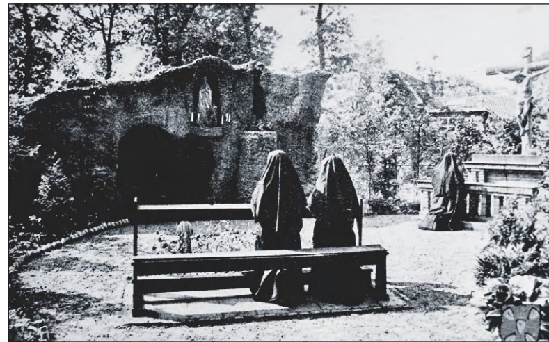
Lourdesgrot St. Gerardus Majella Ziekenhuis.

In de vorige eeuw trokken daar regelmatig processies langs. Toen in 2000 de strook aan de achterzijde van het kloostertuin tegen het spoor aan (nu de Kloosterlaan) werd overgedaan aan de ge-