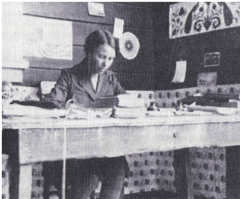
Ina aan het werk (uit boek Paul Schneiders)

www.historischekringbussum.nl hist.kring.bussum@planet.nl