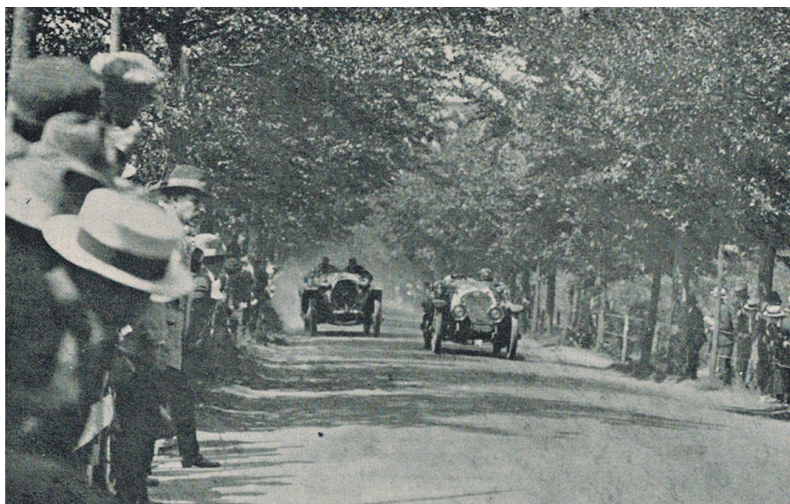
Tijdens de race op de Bussummergrindweg.

“Echte” wedrennen waren het, die de clou van de feestviering bij het 25-jarig bestaan der Kon. Ned. Autom. Club vormden. Op den straatweg tusschen Hilversum en Bussum zijn ze gehouden en al lijken ze nog bij lange niet op de snelheidsraces die in andere landen plaats hebben, toch waren ze voor de toeschouwers interessant en voor de deelnemers spannend.