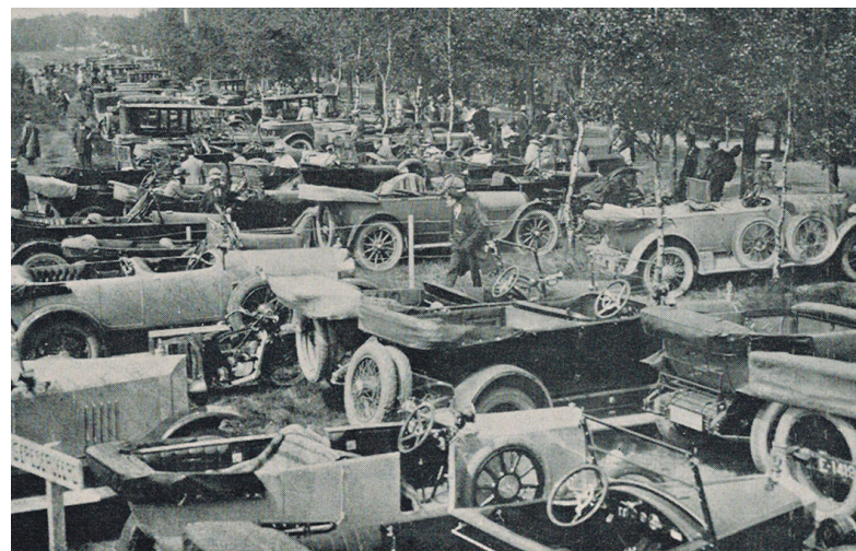
Parkeerterrein langs de Bussummergrindweg op de Fransche Kampheide.

Huizerweg 54 - 1402 AD Bussum Telefoon 035 691 29 68 www.historischekringbussum.nl hist.kring.bussum@planet.nl