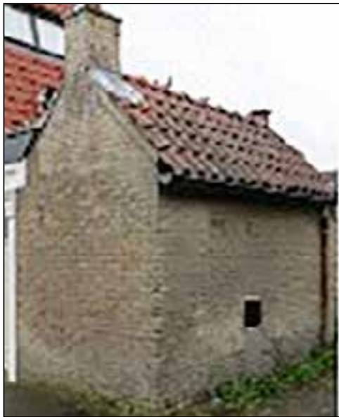
Eén van de weinige oorspronkelijke schuurtjes (2 bij 3 meter) in 2014.

Zo stonden arbeiders, van onder andere Bendsdorp, aan de wieg van de 'R.K. Werkliedenvereniging Sint Joseph' en de niet lang daarna opgerichte 'R.K. Bouwvereniging Sint Joseph'.