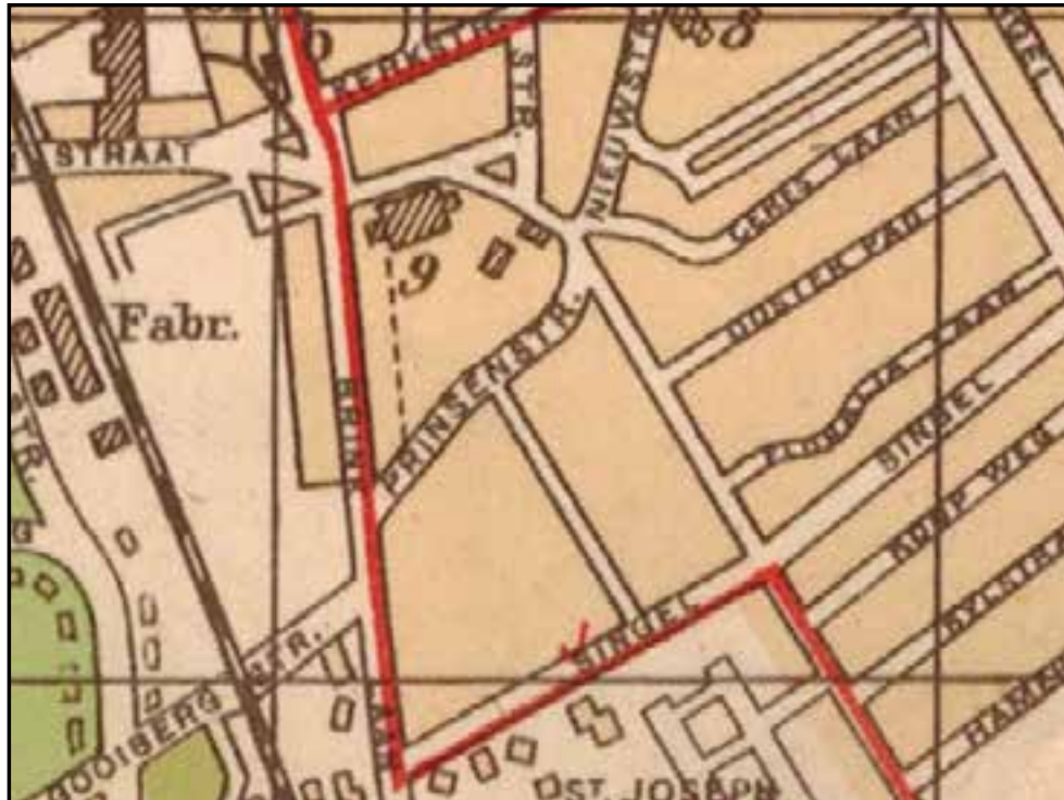
Detail van een A.N.W.B. fietskaart uit 1929 van Bussum. Onderaan het St. Josephpark. Linksboven de Bendsdorpfabriek.

De bouwvereniging ontwikkelde honderd jaar geleden een woonwijkje, dat nog steeds bestaat: het Sint Josephpark. Het wijkje bestond uit, voor die tijd, royale woningen met veel ruimte rondom. Er waren toentertijd veel kinderrijke gezinnen. De bouwvereniging realiseerde voor de bewoners aan de overkant van de Laarderweg ook nog een badhuis. Het woonwijkje ligt nu enigszins verborgen achter de Laarderweg. De woningen liggen aan De Peppels, De Berken en aan een stukje Laarderweg.