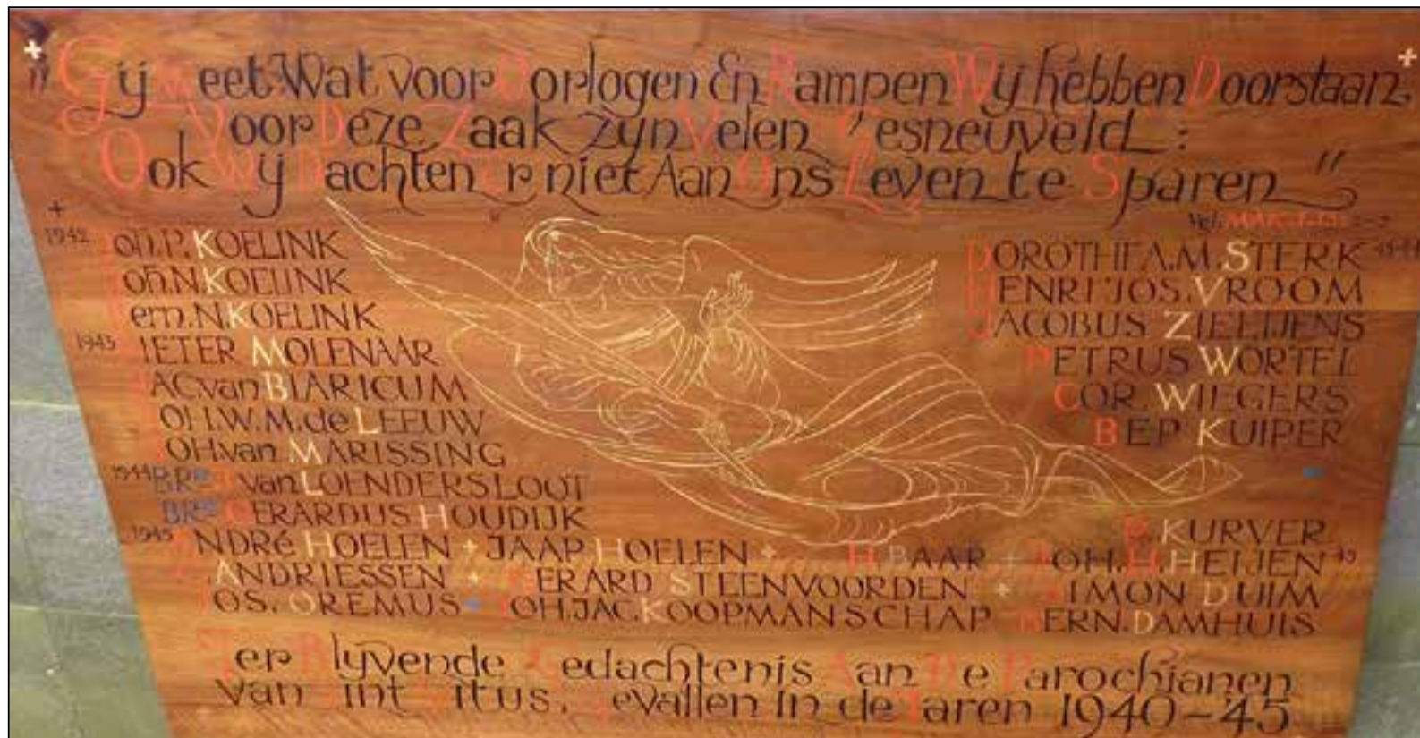
Het bord met de namen; nu in de Mariakerk

Bovenaan staat een variatie op de tekst uit het apocriefe Bijbelboek Makkabeëen I, hoofdstuk 13, vers