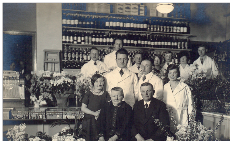
Opa en oma Kreunen met hun vier kinderen en personeel bij een jubileum omstreeks 1930.