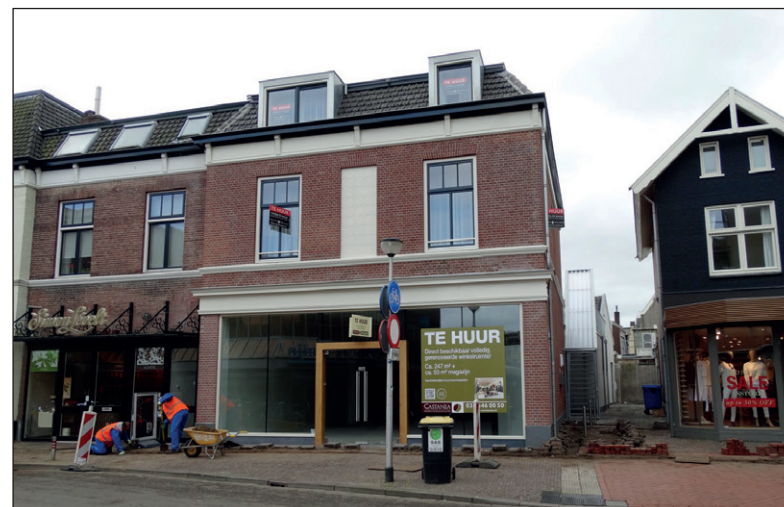
Veerstraat 17 in 2014.